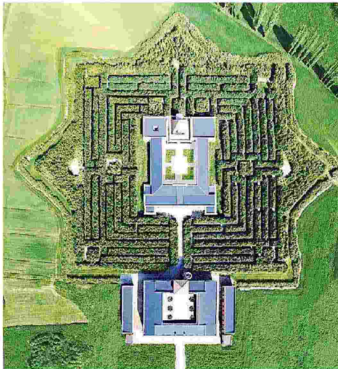
Il labirinto di Fontanellato visto dall'alto